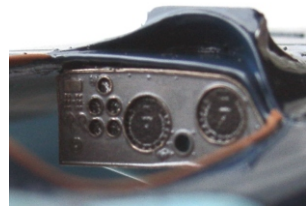
N°2 : Jean-Pierre Wimille & Robert Benoist