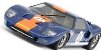
Ford GT40 - Ford MKII