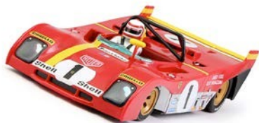
Ferrari 312 PB