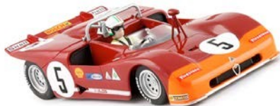
Alfa Romeo 33/3